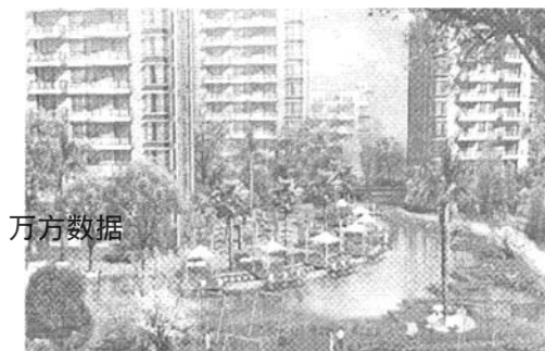
图6 在水一方效果图 Fig. 6 Result of "Zaishuiyifang"