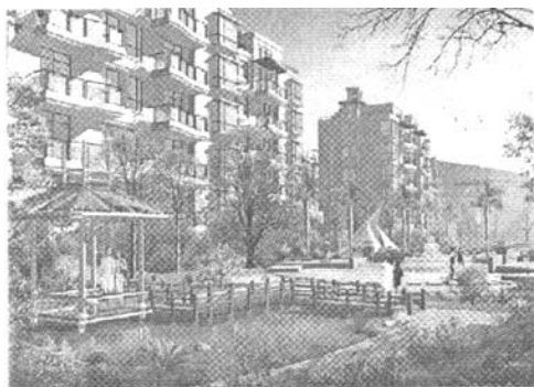
图5 曲桥探梅效果图 Fig. 5 Result of "Quqiaotanmei"

构架以及情人岛的设计,以“七”的涵义表达传统文化中对爱情的描绘,隐喻“所谓伊人,在水一方”的浪漫(图6)。