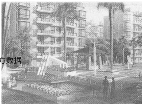
图2 趣练仙棋效果图 Fig. 2 Result of "Qulianxianqi"