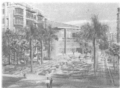
图4 得水为上效果图 Fig. 4 Result of "Deshuiweishang"