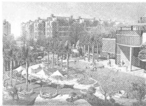
图1 水木天成效果图 Fig. 1 Result of "Shuimutiancheng"

景观构架及景亭等设施,使之成为北入口及景观大道的对景,景亭取名“撷华亭”——取“采撷天地精华之灵气”之含意(图2)。