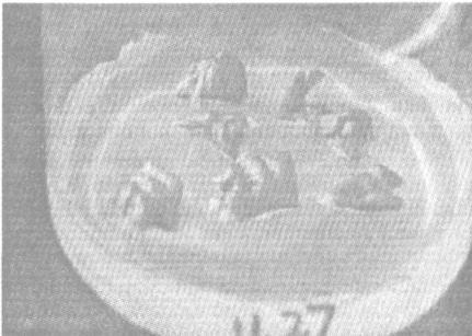
图 2 在附加 NAA 的 MS 培养基上, 愈伤组织可直接长根