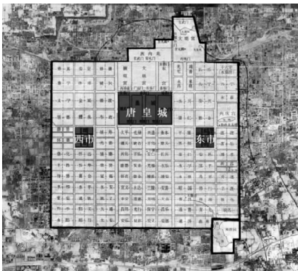
图2 唐长安城与现西安卫星影像叠加图