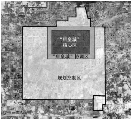
图1 “唐皇城”复兴规划范围

规划建设的主要内容包括:以恢复“唐皇城”的历史风貌为前提,加大对文物古迹、历史街区 and 传统民居的保护力度,依据老城现状和发展条件,人口逐步外迁,控制核心区人口数量,最终将核心区划分为20个里坊(图2),使之成为有鲜明传统地域特色的,以旅游、商贸、居住为主的城市功能区。实现史迹保护化、社区里坊化、交通绿色化、轴线对称化、生态持续化、风貌协调化、旅游特色化 [2] 。