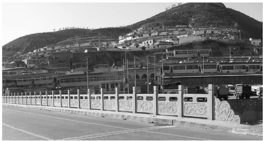
图 5 与山体融合的城市建筑风貌

2)建筑风格 旅游区是反映一个城市风土人情的重要景观空间,在红色文化旅游区将当地窑洞的