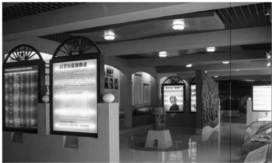
图 6 革命纪念馆

传统民居元素与现代建筑符号相结合,如革命纪念馆内外运用的窑洞元素(图 6),使现代建筑景观与地域文化联系起来,从而保护和传承了特色民居文化。在商业中心、商贸市场、会展等作为吴起地标建筑也以橙、红色系作为建筑的基色,反映红色文化地域特征,符合在红色文化的影响下吴起人民对红色和黄色的偏爱。