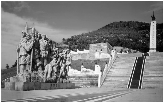
图 4 长征广场 Fig. 4 Chang Zheng square

史元素,并以数字语言铭刻在景观中,创造红色地域文化鲜明的景观空间,符合公园作为历史文化中心的功能特征。