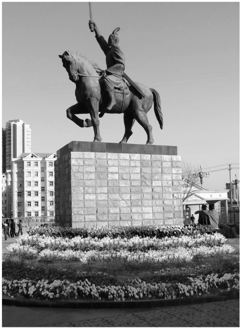
图 3 “吴起”雕塑 Fig. 3 “Wuqi” sculpture