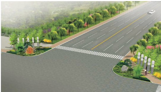
图 7 节点景观设计三