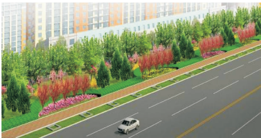
图 1 标准段 A 景观设计 Fig. 1 Landscape design of Segment A

1)标准段 A 此标段(图 1)位于昌盛街至老 107 国道之间的两侧绿带。该路段长达 700 m,两侧绿地断口较多,且道路两侧多为公司企业,其间除星马郡都小区外再无其他居住区。因此,该路段绿带设计为封闭式绿地形式,绿带中不设园路。此段在邻近便道一侧,以半圆形圆弧绿篱为单元,连续重复;圆弧内配置 5 株紫叶李( Prunus cerasifera var. atropurpurea ),紫叶李下为丰花月季( Rosa chinensis var. floribunda );圆弧单元之间配置 3 株白皮松( Pinus bungeana )作为过渡。该单元配置以后面的乔灌木为背景,层次清晰。道路两侧左右对称,其绿化效果整齐大方,富有节奏与韵律。