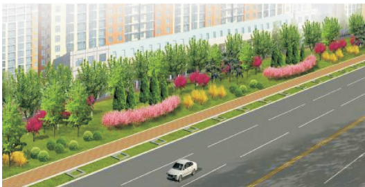
图 2 标准段 B 景观设计 Fig. 2 Landscape design of Segment B

则是指由 2 个配置单元交互重复,自然是指每个单元的植物配置采用自然组合形式。在植物配置单元中以 5 株桧柏( Sabina chinensis )树丛居中构成核心,在桧柏两侧分别配以 3 株碧桃( Prunus persica )和 5 株紫薇( Lagerstroemia Rndica )花灌木,其前面为开黄色花的棣棠( Kerria japonica )或开红色花的重瓣郁李( Prunus japonica var. Kerii )灌木丛。该配置单元核心突出,高低错落有致,绿、红、紫 3 种色彩搭配有序,相邻单元以红黄两色花灌木树丛交替。故该段配置效果既自然又有节奏之感。绿地中乔木树冠下配置玉簪( Hosta plantaginea )地被,也颇为美观。