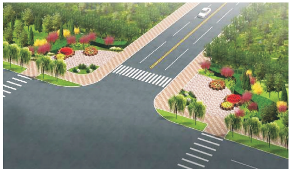
图 5 节点景观设计一

1)节点一:轮转千里 该节点(图 5)位于鹏城大街与华建路交叉路口,该路口为丁字路口,西部道路两侧为金地、朗瑞机械设备制造企业。为展示定兴支柱产业之一的机械制造业,以机械制造业的典型零部件—齿轮为素材,设计了齿轮花坛造型。齿轮花坛既可观赏,又可供行人停留坐息。花坛后面点缀紫叶李彩叶树,并以模纹绿篱及桧柏、花灌木树丛、大乔木等为背景,其广场效果高低错落,色彩丰富,自然大方。