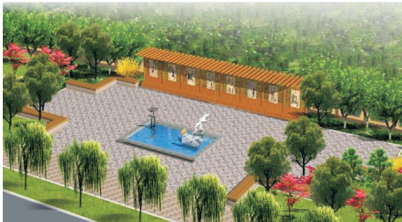
图 4 元曲广场景观设计