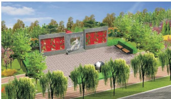
图 3 太极广场景观设计 Fig. 3 Landscape design of Taiji square

1)太极广场 该广场(图 3)位于老 107 国道中石化加油站的东侧,广场入口正对处设镂空景墙,景墙中以太极为内容镂空出相应人物造型图案。在两段景墙之间设一尊武师打太极的石雕。与雕像正对之入口中央,置一阴阳鱼球体与雕像呼应。寓意定兴是孙式太极武学文化的重要发祥地。