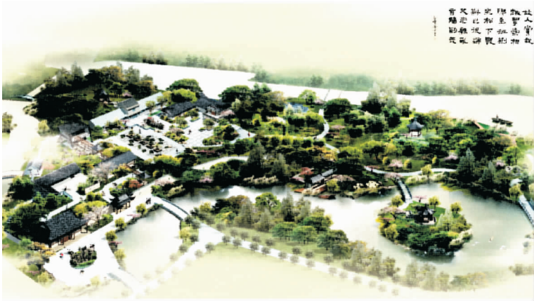
图3 古澄园景点修复设计效果图